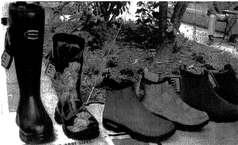
Wasserdichte und originelle Stiefel für Hundeleiter und andere werden neu im Petshop angeboten.